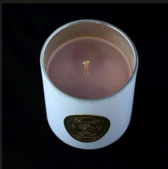
Very Casati rose Note fiorite