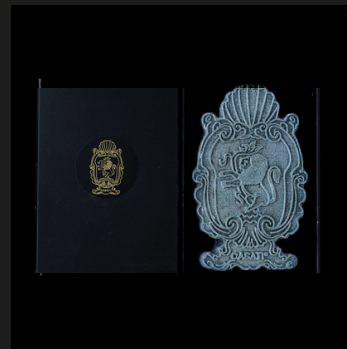
Big Cameo sugar paper Note ambrate