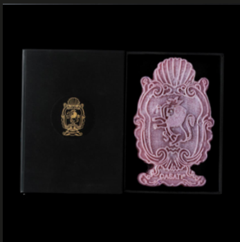
Big Cameo rose Note fiorite