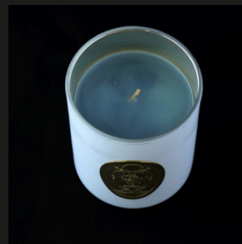
Very Casati sugar paper Note ambrate