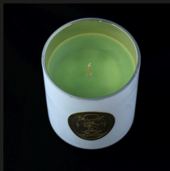
Very Casati green Note dolci