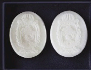
CASATI CAMEO WHITE GOLD

prix en détail: camée simple 38 €, camée double 48 €