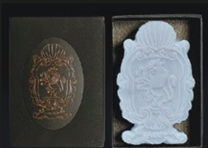
CASATI BIG CAMEO WHITE GOLD