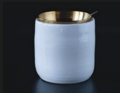
BRÛLEURS CASATI WHITE GOLD

prix public : bougie avec couvercle 130 € bougie 90 €