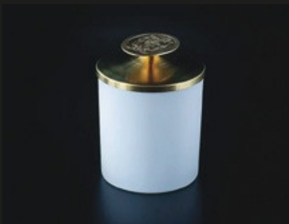
BOUGIES VERY CASATI WHITE GOLD

prix en détail: camée simple 38 €, camée double 48 €